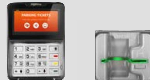
SÉRIE AUTO MODULAR