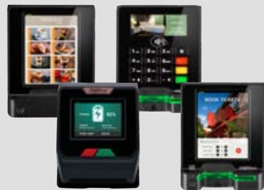
SÉRIE SELF ALL-IN-ONE