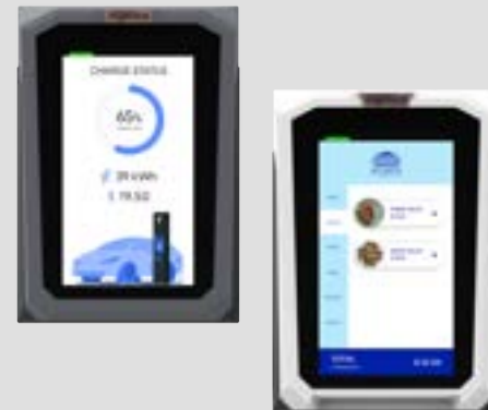
SÉRIE AXIUM SX